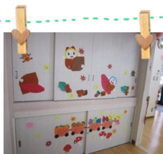
フレイルームも秋です♪