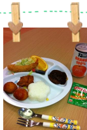
おいしそうなお子様ランチ！